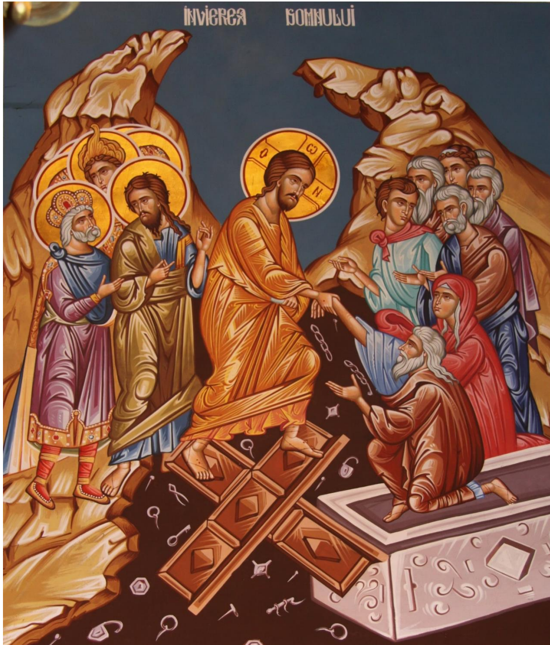
Auferstehung des Herrn Deckenfresko Kloster Floresti, Rumänien

Christus ist auferstanden! Er ist wahrhaftig auferstanden!