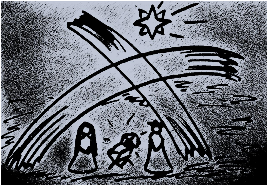
Krippe unterm Kreuz